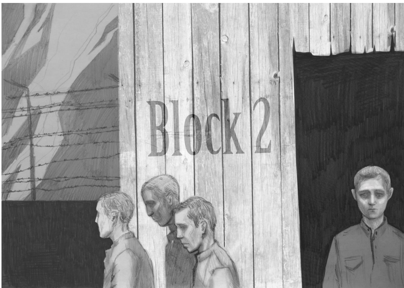
графическая иллюстрация, художник Коурова Елена