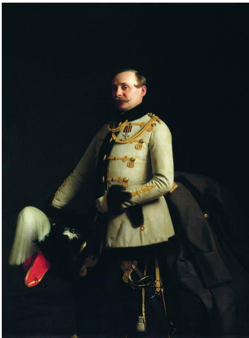
Портрет Александра Дмитриевича Пономарева (1855 г.) Холст, масло. 178x133,5 см

В 1781 году Шадринск получил статус административного центра Шадринского уезда Пермской губернии. Поэтому нужно было думать о перспективах. На рубеже XVIII — XIX веков в городе было создано местное казначейство. Какие же деньги «крутились» в Шадринске в те времена? В июле 1839 года, по случаю установления новой денежной системы, был принят Манифест о переходе на серебро разных платежей. С ведра кизлярских водок крепостью от 21 до 55 градусов взимали по 75 копеек серебром, а за штоф вина полугарного (1/8 ведра) — 30 копеек, за чарку — 3 копейки... Так вот, шадринские откупщики должны были за вино в городскую казну ежегодно платить 110240 рублей! Шадринск рос и развивался, и к 60-м годам в городе владели недвижимостью 62 чиновника, 18 священно-церковных служителей, 542 мещанина, 119 крестьян, 137 солдат и 139 купцов.