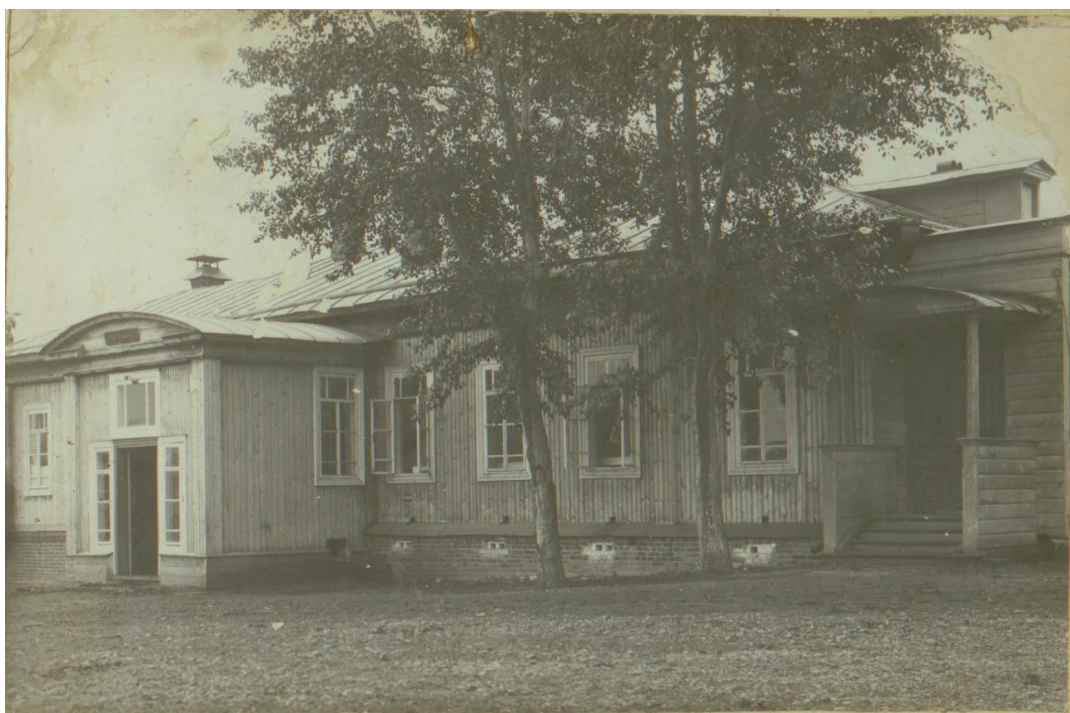
Здание родильного дома, построенного в 1917 г.

Выйдя на пенсию, Е.Д. Садовникова уехала в Пермь.