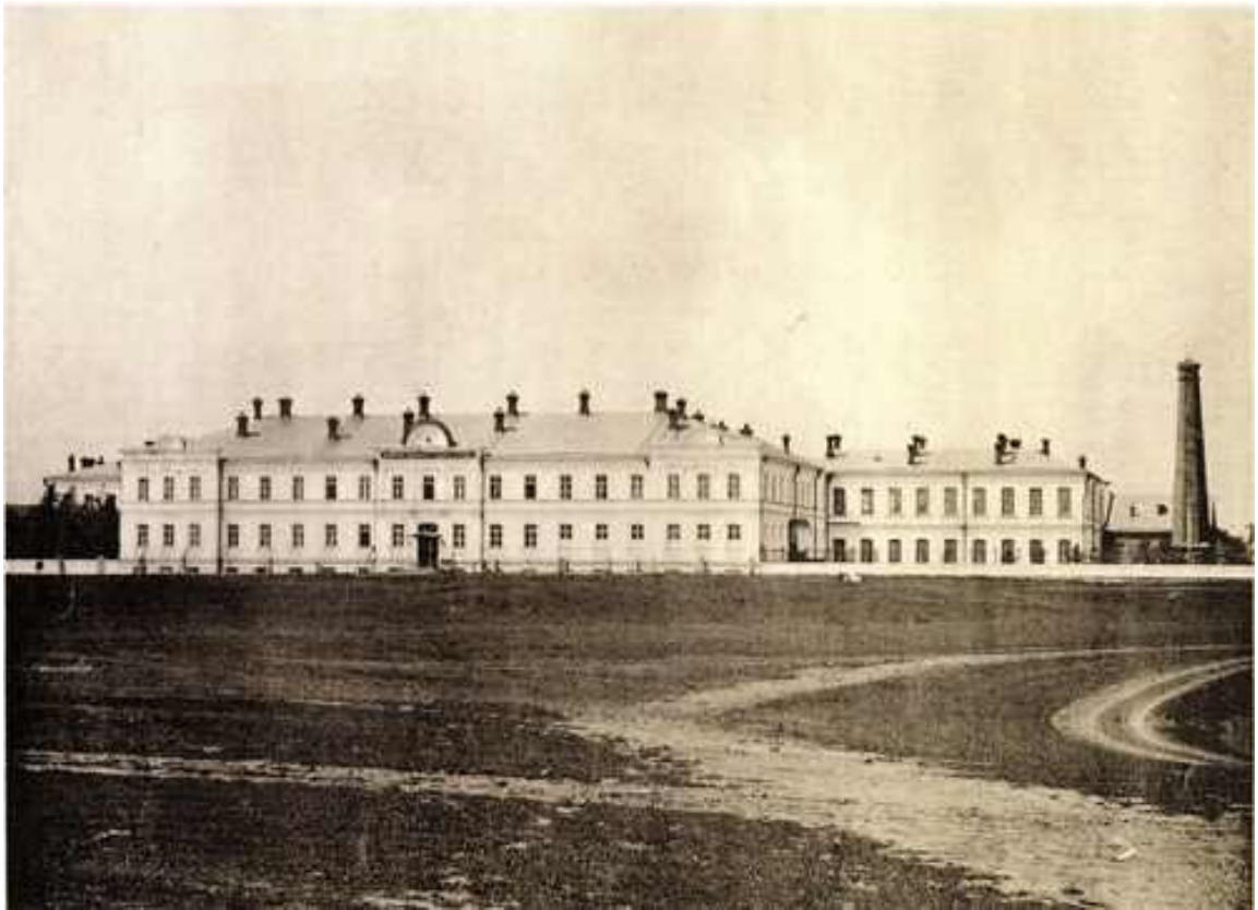
Училище им. А. С. Губкина в Кунгуре.

В настоящее время здесь располагается автотранспортный колледж