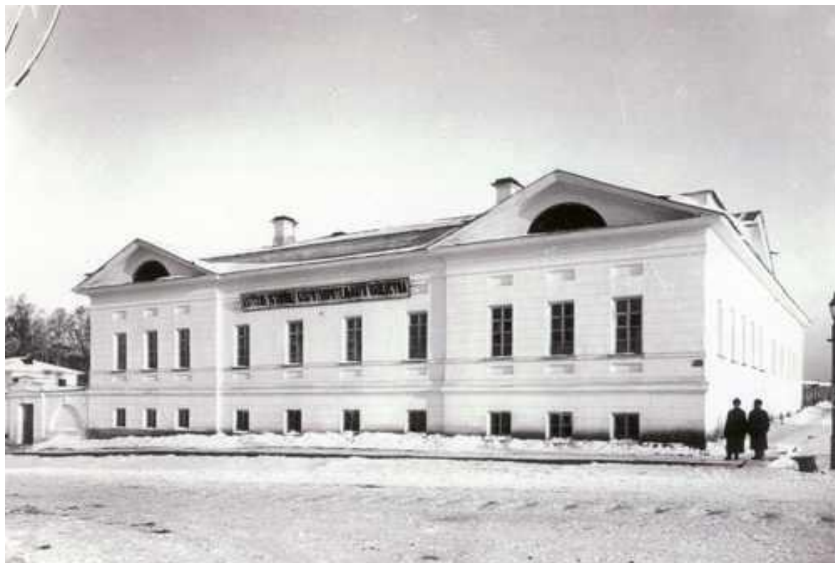
Дом «детского убежища» в Екатеринбурге, где проводились Палестинские чтения ИППО