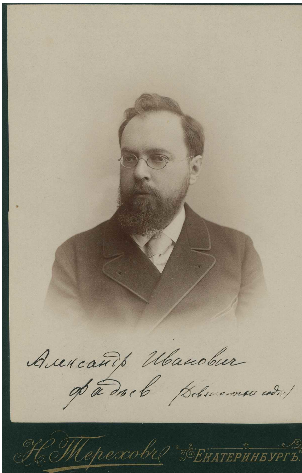
Фадеев Александр Иванович