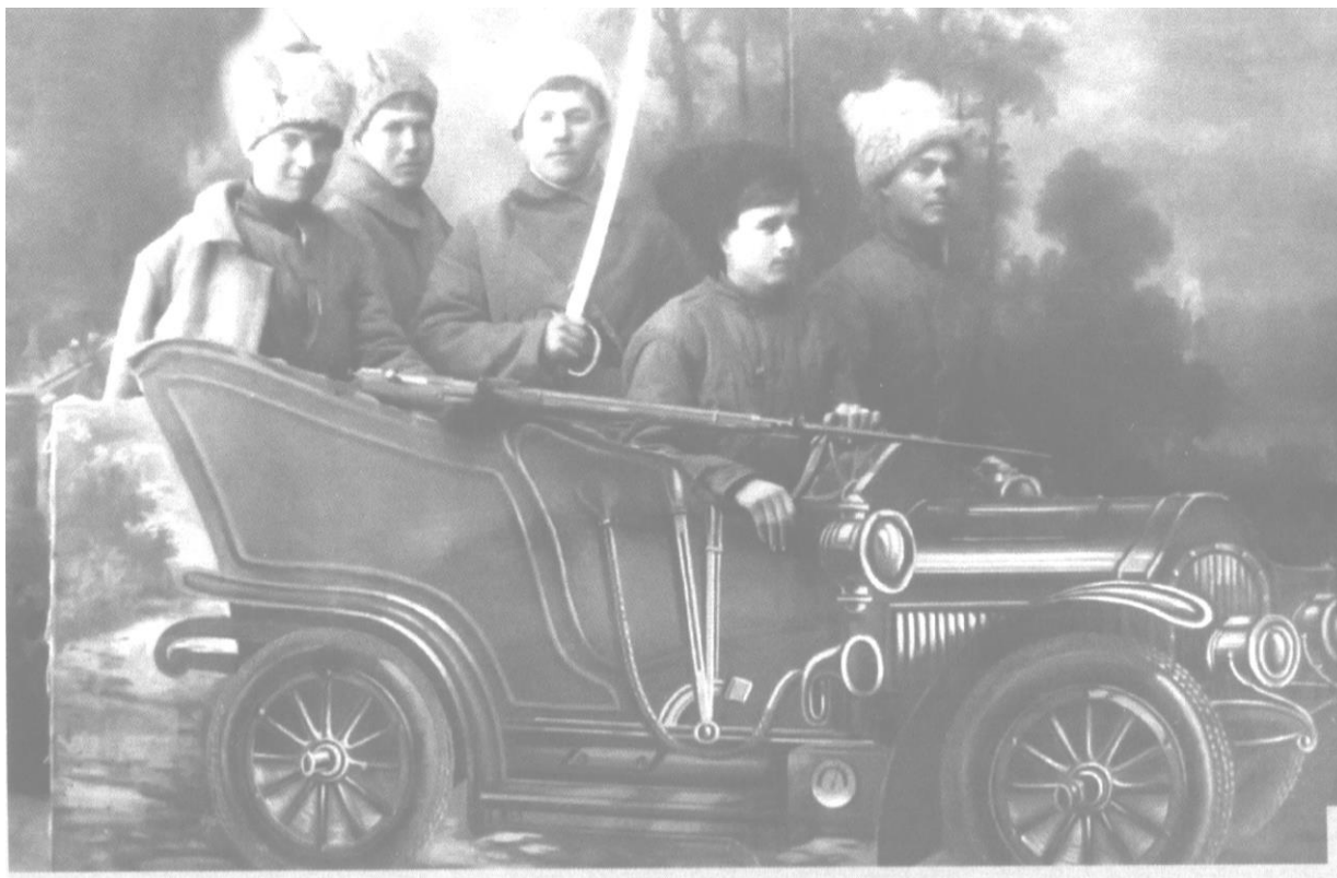
Красноармейцы в Осе