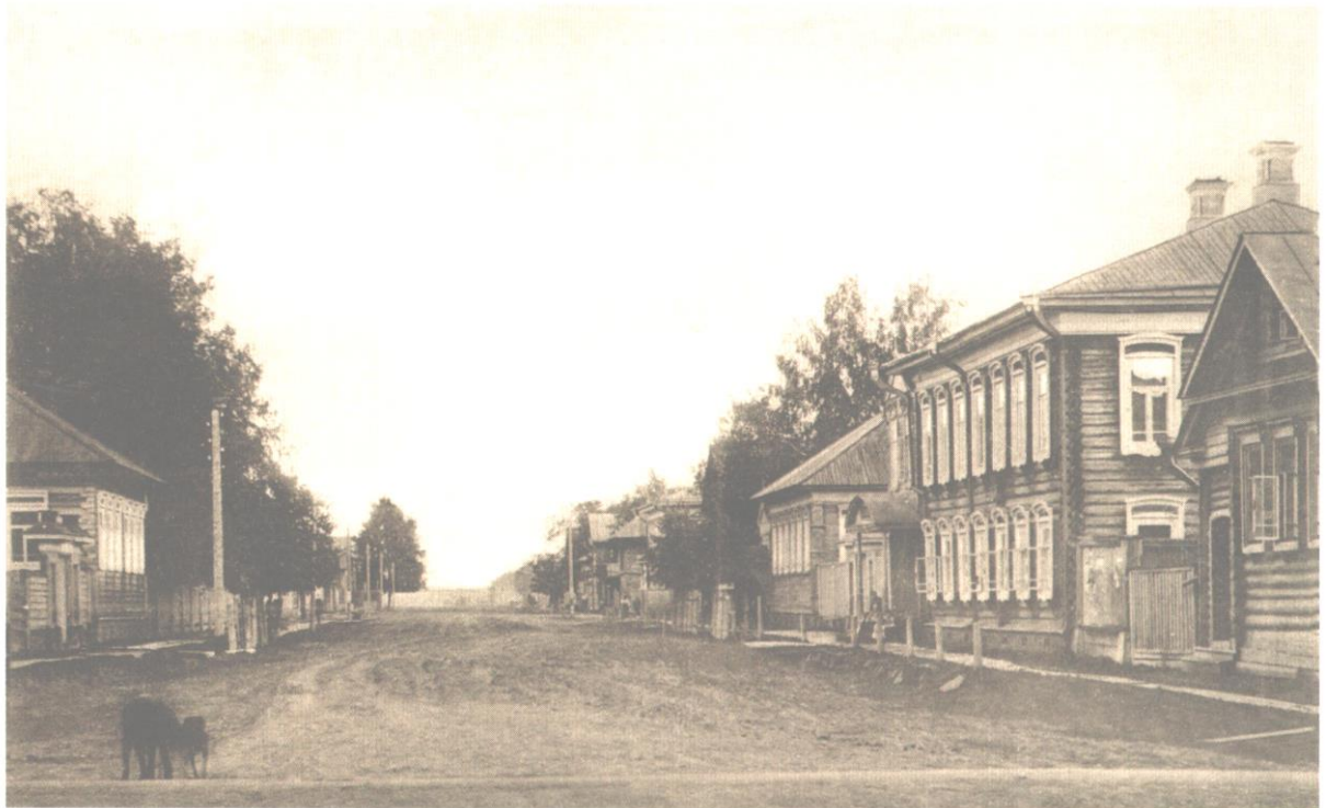
Лавровская г. Осы

К 19 февраля 1919 года 3-й Степной Сибирский корпус генерал-лейтенанта Вержбицкого вышел к рубежу реки Тулвы, а левым флангом - к г. Осе, завязав за него бои. На город наступали: 3-я Иркутская Сибирская дивизия генерал-майора Гривина в составе: 9-го Иркутского, 10-го Байкальского, 11-го Нижнеудинского и 12-го Верхнеудинского полков и колонна подполковника Казагранди в составе: 15-го Курганского, 16-го Ишимского и 3-го Оренбургского казачьего полков. Слева действовала 7-я Степная Сибирская дивизия полковника Черкасова в составе: 27-го Верхотурского и 28-го Ялуторовского полков. На самом правом фланге корпуса в районе Чернушки вела бои 15-я Воткинская дивизия полковника Альбокринова в составе: 1-го Воткинского, 2-го Сайгатского, 3-го Осинского и 4-го Сводного Воткинского полков.