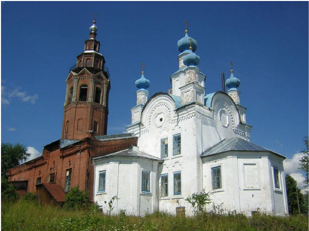
Собор Воскресения, где венчались Протопоповы

Среди партизан было двое раненых. Среди мужиков было 6 убитых и 10 раненых. Противник потерял 40 человек убитыми, 60 ранено и человек 150 сдалось в плен. Был захвачен огромный обоз – более 300 повозок. Пулеметы и патроны Протопопов оставил себе, а все остальное (мука, сахар и т.д.) отдал местным жителям и мужикам. После отдыха решили двинуться в Ныроб, но узнали, что мужики обещают пробить дорогу до Ныроба. Решили заночевать, что оказалось кстати, т.к. красные собрались в лесу и решили отбить деревню. Латыши выслали разведку в 5 человек, дав им задание захватить хотя бы 1 пулемет. Разведка подошла совершенно незаметно и стала распаковывать один воз. Тут из избы вышел партизан, который заметил латышей. Не поднимая тревоги, он вернулся в избу. Там находился капитан Козлов, который разбудил партизан и приказал окружить красных, что и было сделано. Латышам ничего не оставалось как сдаться. По показаниям пленных узнали где находится отряд латышей. Отряд был поднят по тревоге. Латыши были окружены и сдались при первых выстрелах.