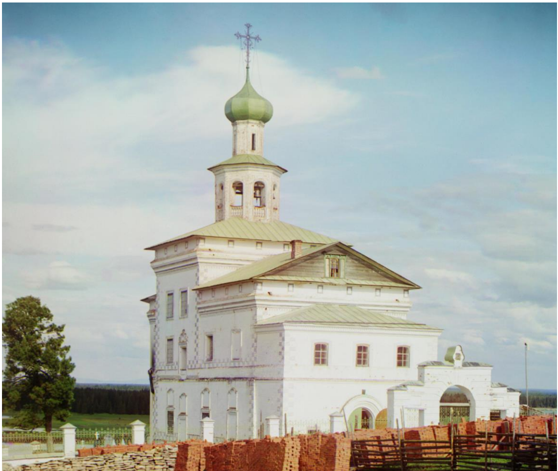
Иоанно-Богословский женский монастырь