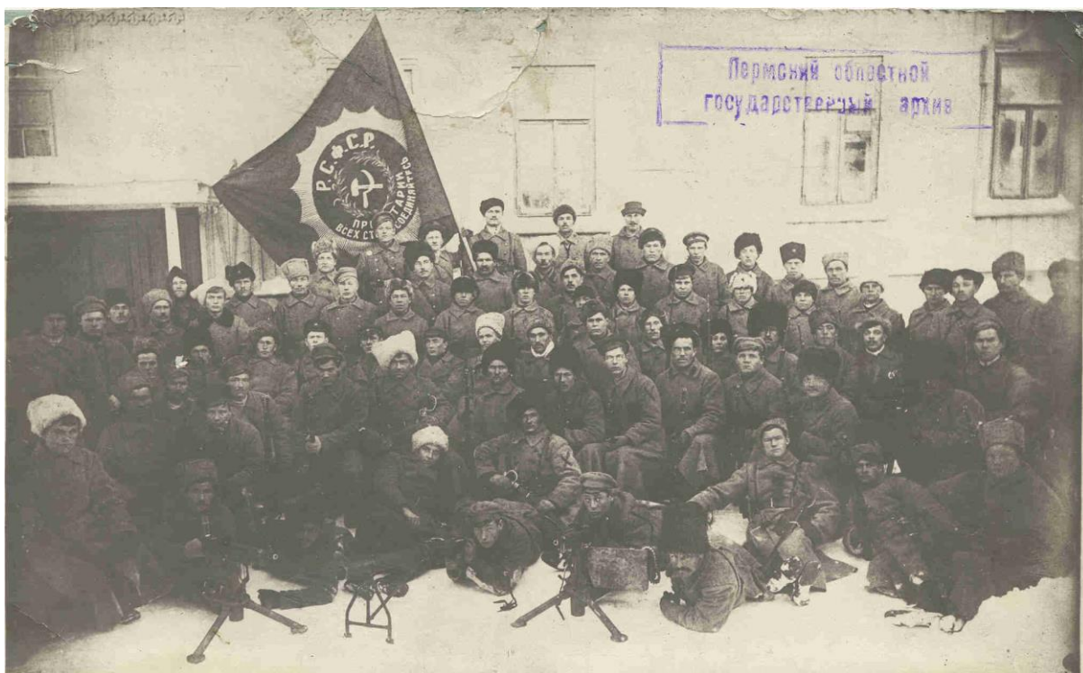
Чердынский отряд ЧК